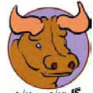
كا ۵/۲ تا ۱۲/۳