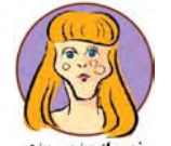
فەرىقە ۹/۲ تا ۸/۲

لە پرۆژەيە كەدا دەستەكەوتىكى دارايىت دەست دەكەوتىت كەچاومروان نەبووى بەو شىۋەيە قىسازاجى ھەبەيت، لەخۇبايى مەبەو دلت بۆ خۇشەويستەكەت بگەرەوە چونكە سوودى تۆى تىدايە .