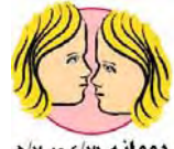
دووانە ۵/۲ تا ۱۲/۳