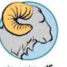
كاور ۱۲/۳ تا ۲/۳