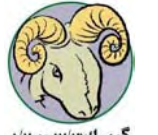
گىسەك ۱۲/۳ تا ۹/۲