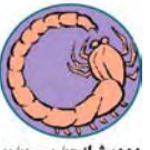
دوويشە ۱۲/۳ تا ۹/۲