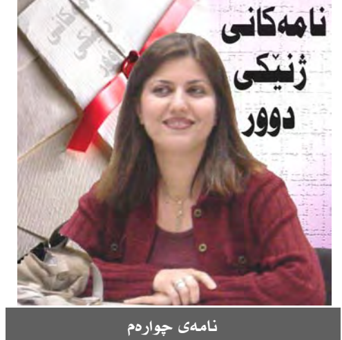
ناھەكانى ژنىكى دوور

* باش تىپەرپوونى دەھەپەك بە سەر ئازادى كوردستانى باشووردا ، چۇن دەروانە ئەو بىزوتنەوانەى كە ئىستا بە ناوى ژنانەوھ لە كوردستاندا كارەكەن ؟ . ديارە ناتوانىن ھىلى راست و جەپ بە سەر كارى رىكخراوھكاندا بھىنن و بلىن ھىچيان نەكردوھ ، بەلام لەوانەيە خۇتان ئەوھ بىزانن كە خۆم رۇژئ لە رۇژان لە گەل رىكخراوھكى ژناندا كارم نەكردوھ ، چونكە باوھرم بە بى شوناسى نەبووھ لە كاركردن و ژيانى پراكتىكى خۇشەدا . پىم وايە لە سەرتاوتو كۇتايەوھ سەرگەوتن و بتەوى ھەر پىرۇزەيەك مەمانە دەخاتە سەر شوناسى ئەو پىرۇزەيە : شوناسىش لە دەروھى شىرۇفە كۆمەلەيەتى و كەلتورى و رۇشنىرەكان بەر جەستە نابىت . ئەو رىكخراوانە تا ئىستا خاوەنى شوناسىكى دىبارىكارو نىن كە مەمانەى بەرگىكردن لە ژن بە دەرووبەر بېخەشەت ئەوان ناتوانن بىن بە خاوەنى ئەو شوناسە باوھرپىكاروھش ھەتا لە نىو كايە كۆمەلەيەتە چىواواھكاندا ، لە چوارچىوھى پىرۇگرامىكى خۇجياكەوھ و خواسەتەكى مېنئانە نەكەونە مەلمانەى ناسىن و خۇناسانن . نەكراوھ ناكىت كەسەك دەزگايەك ، رىكخراوھك داواى شوناسى كەسانىكى دى بىكات و خۇى خاوەنى ئەو شوناسە نەبىت ، خۇى درك بە گىرنگى ھەبوونى شوناس و واتى ئەبوونى نەكات . پىم سەپىرە ھەندئ جار ژنانىكى ئەو رىكخراوانە ھىندە بە كارەكانى خۇيان دەنان و ھىندە مەنت بە سەر ژنانى بەش مەينەتەيدا دەكەن واپىشان دەدەن ئەو كارەى ئەوان دەپكەن لە سەروو لۇژىك و باوھرپىنەوھەيە . ئەمە لە كاتىكدا ھەتا ئىستا گىرگرتنى رىكخراوھكانى كوردستان لە سى رەھەندا خۇى نمايش دەكات ئەوانىش كىشەكانى ژن كوشتن و جىابوونەوھ و ھەندئ ماق ساكارى دىيە ، لە كاتىكدا لەو شوپانەى وەكو كوردستان بانگەشەى دىموكراسى دەكەن لە كىشەكانى ژناندا بە دووى رەھەندى چوارەمدا دەگەرپىن