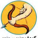
كەوان ۱۲/۳ تا ۹/۲