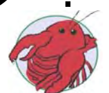
قززال ۷/۲ تا ۶/۲