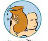
سەقن ۱۲/۳ تا ۹/۲