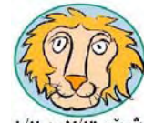
شېتر ۸/۲ تا ۷/۲