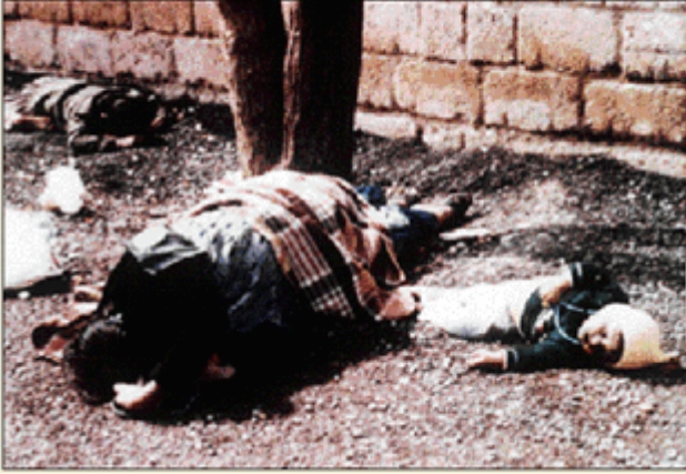
Män, kvinnor och barn gasas ihjäl vid anfall mot staden Halabja.

5 000 människor dödas i gasattack mot kurdiska Halabja