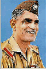
Abd Karim Kassem.

ديسان کۆده‌تا: له ساڵی 1963دا، عهبدولکه‌ڕیم قاسم لابردرا و کوژرا. له‌شه‌مردووه‌که‌ی له شاشه‌ی تیڤی پيشان درا. پارتی به‌عسی عه‌ره‌بی سۆسیالیستی به‌شداریی کۆده‌تایه‌که‌ی کرد، به‌لام لایه‌نگه‌کانی هه‌ر زوو دوورخرانه‌وه.