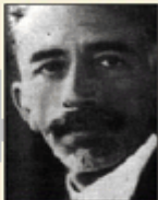
Faisal ibn Hussein.