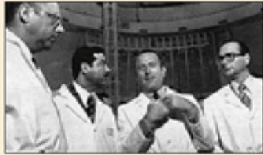
Saddam Hussein träffar Jacques Chirac.