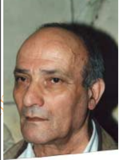
ئه‌کادیمی که‌ریم ره‌ش