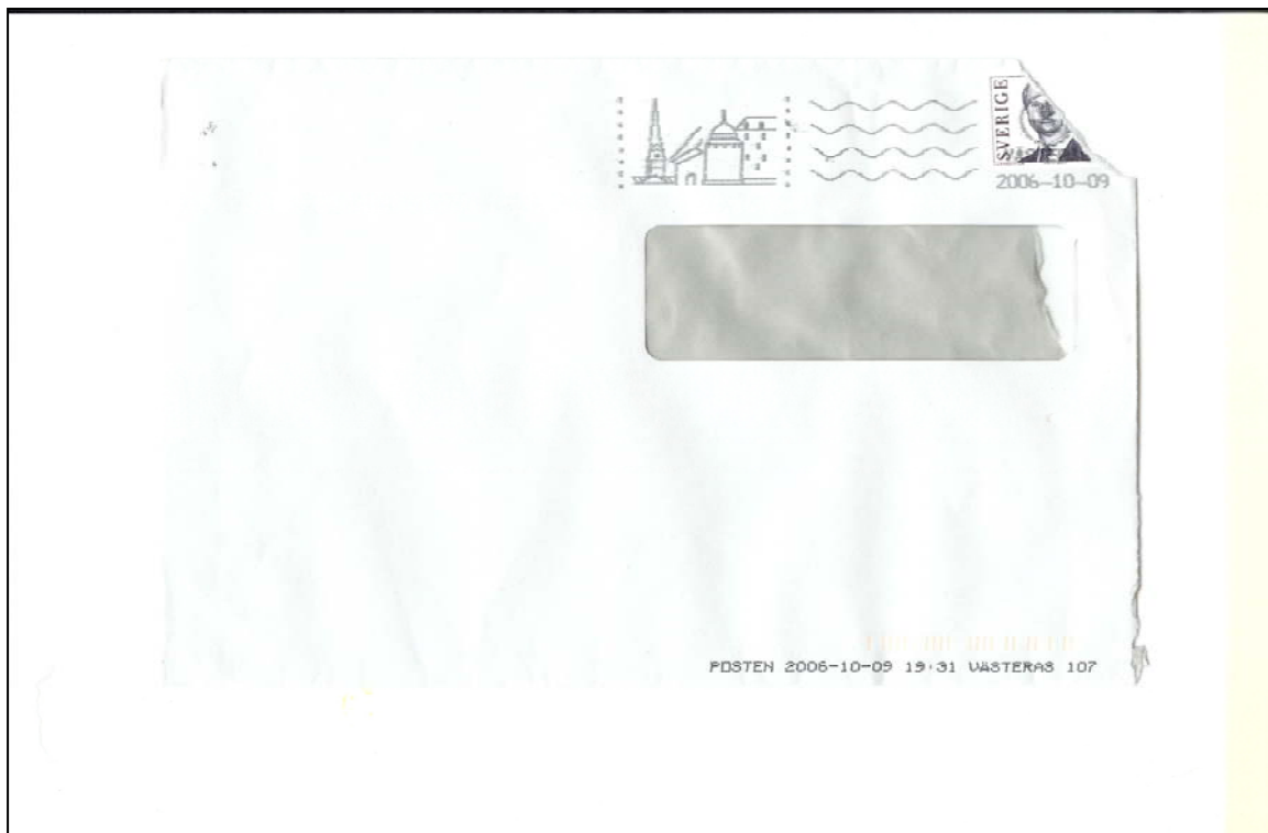
پووی به که می پاکه تی نامه که