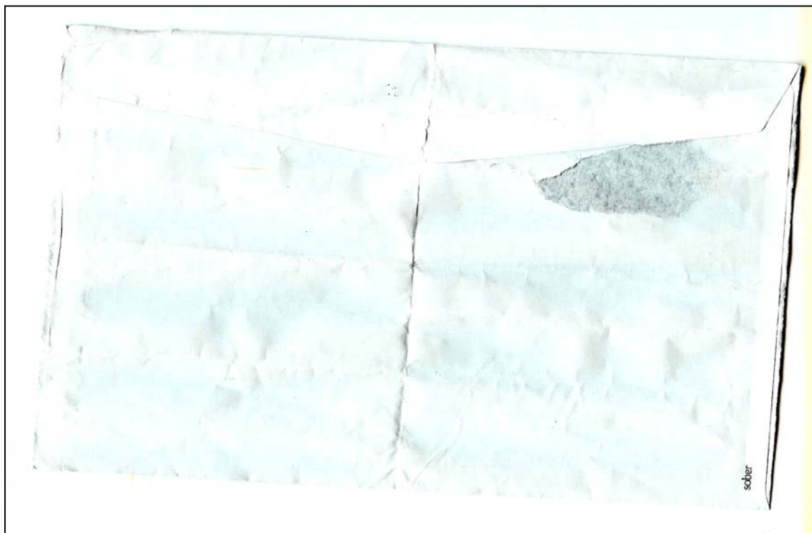
پووی دووه می پاکه تی نامه که