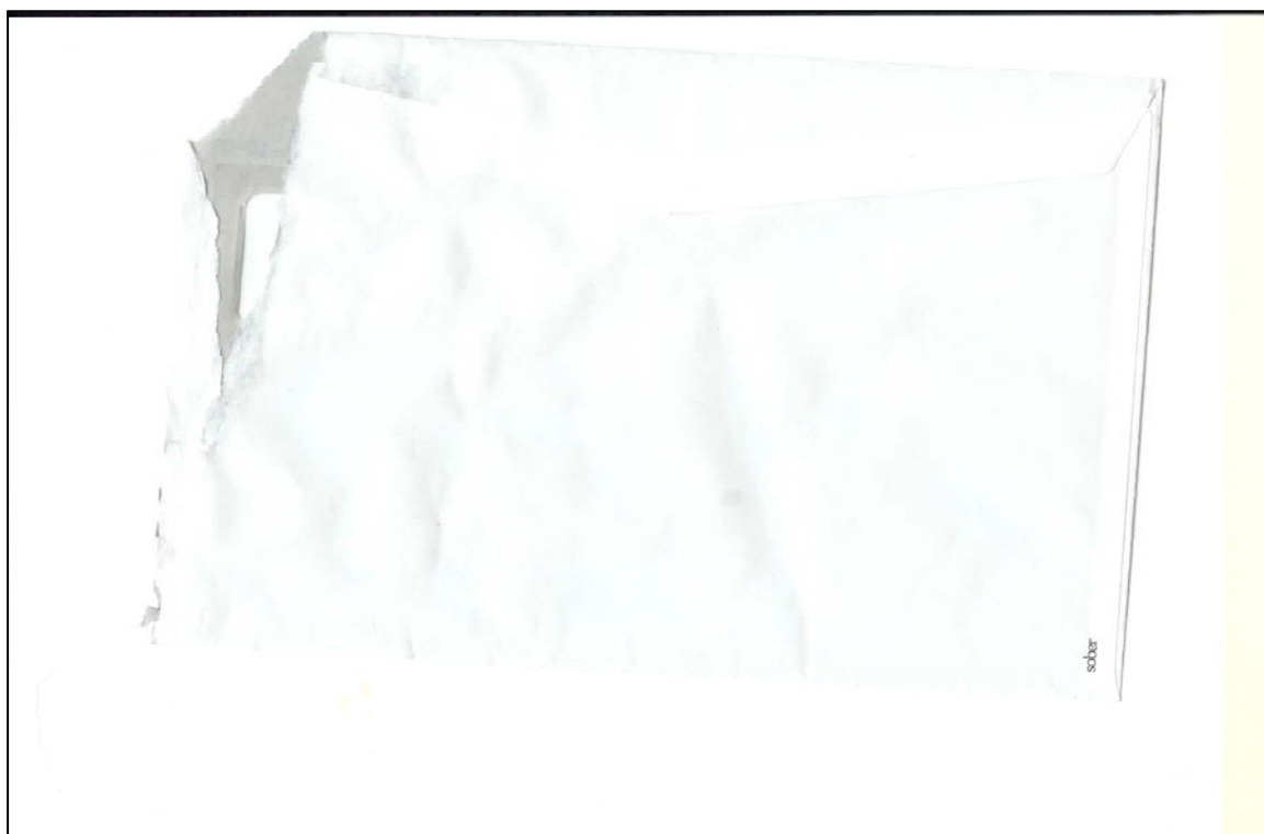
پووی دووه می پاکه تی نامه که