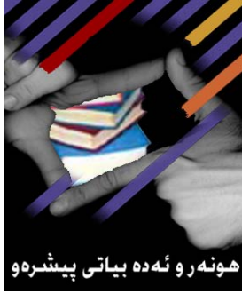
هونهرو نهده بیاتی پیشرهو ۵ل