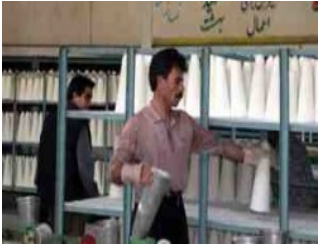
روداوی شوينی کار تاوانی جينایی خاونکاره ۷ل