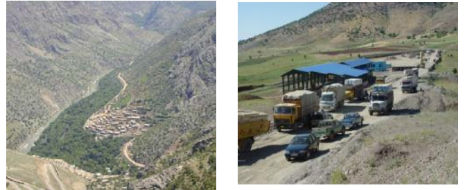
موقاوهمت بهرانبهر به دهست دريژي رژم نه سهر سنورهکان ۷ل