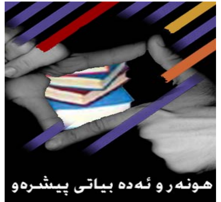
هونهرو نه ده بیاتی پیشردو

سال۱۳۶۱ تارمایه کی ره شی نگریش زیاتر بالی به سر نیراندا ده کیشا، کیش وهه وای نیرانیش زیاتر قوربانی ده گری. "دیسانیش هه ر بکوژن، چ گهله کومه یه کی باشت لوهه؟ بو ریگرتن له یادی تیکوشه ریگی کومونیسیت که له رهش ترین روژه کان له ژیر وه حشیانه ترین نه شکه نه جدا زورتین خوراگری له خوی نیشان دا و سر به رزانه گیانی به خت کرد، لا پهری هونهرو نه ده بیاتی نه م ژوماره یه بو یادی هاوری گیان به خت کردوو سوهراب غولامی ته رخان کراوه