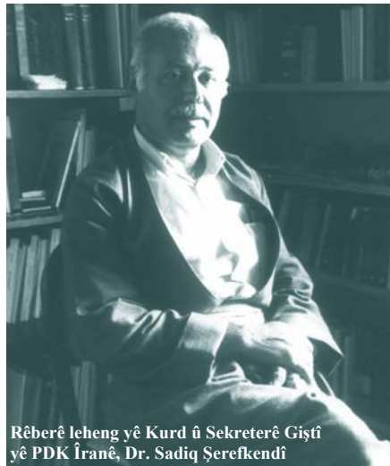
Rêberê Icheng yê Kurd û Sekreterê Giştî yê PDK Îranê, Dr. Sadiq Şerefkendî

dîplomatîk yên rejîma Komara Îslamî ya Îranê jî cehd û hewleke bilez dan ku pêvajoya gavên dewlet û dezgehên têkildar yên Almanya ji bo venasîn û eşkerekirina gunehbarên vê bûyerê ji rêya eslî derxin û nemeza di vê pirsê de gelek hewilîn ji ceribîna bûyera Viyenê û şehîdkirina rêberê me yê zana û mezin Dr. Ebdulrehman Qasimlo û hevalên wî mifahê werbigirin û bi dan û standinê bazirganiyê dewleta Almaniyayê jî razî bikin. Lê hestkirina bi berpirsiyariya dewletê, serxwebûna dezgeha dadê û hişiyariya polisê Almaniya tev bizavên rejîma Komara Îslamî ya Îranê yan bêencam hêlan û berevajî xwestekên wan tevahiya cehd û şiyana xwe ji bo bi encam gihandina vê lêkolînê xiste rojevê bona vê çendê ku wan destên reş li piştê vê tawanê eşkere bikin û di nava kom û Komeleyên navneteweyî de şermezar bikin.