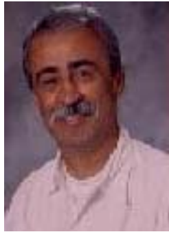
تەرجىمە سىيامەند ھۆججەت